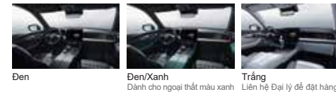
Đen Đen/Xanh Dành cho ngoại thất màu xanh Trắng Liên hệ Đại lý để đặt hàng